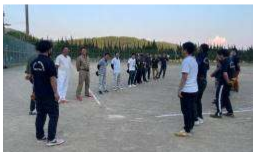
(左) 開会の挨拶 まずはあいさつから!

壮青年部のソフトボール経験者によるピッチングに青年部の打線が沈黙。粘り強さをみせた壮青年部が逃げ切る形となりました! 午後8時近くまで熱戦が繰り広げられ、その後は青年部(株)丸菱さんの大阪王将にてインボイスに関する研修会を行い、懇親会が開催されました。青年部員と壮青年部員が互いに自己紹介を行うなど有意義な懇親会となりました。