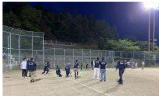
(右) ナイターでの本格的ソフトボール大会