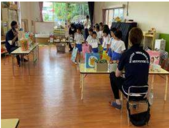
(左) くじ引きを楽しみに待つ幼児たち

南丹市商工会青年部は、聖家族幼稚園の「なつまつり」に参加させていただきました。ハツラツとはしゃぐ幼児たちは非常にエネルギーで、逆に元気をいただきました。青年部員は夏祭りの行事のサポート及び食品を提供させていただきました。南丹市での幼児たちの思い出がひとつでも増えることを願って。